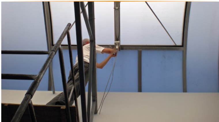
Fot.1 Montaż kontaktronu na ramach kłapy przeciwpożarowej

Opisywaną modernizację wykonały wspólnie firmy ABBM Sp. z o.o. i Protokol Sp. z o.o.